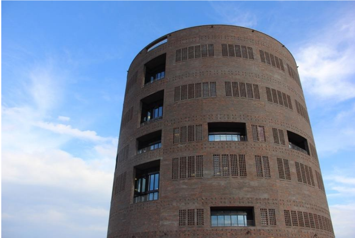
Trafik Control Center Øst

Byens Netværk besøger endnu engang Banedanmarks nye Trafik Control Center Øst, som snart står færdigt, hvor vi hører om byggeriet og får en rundvisning.