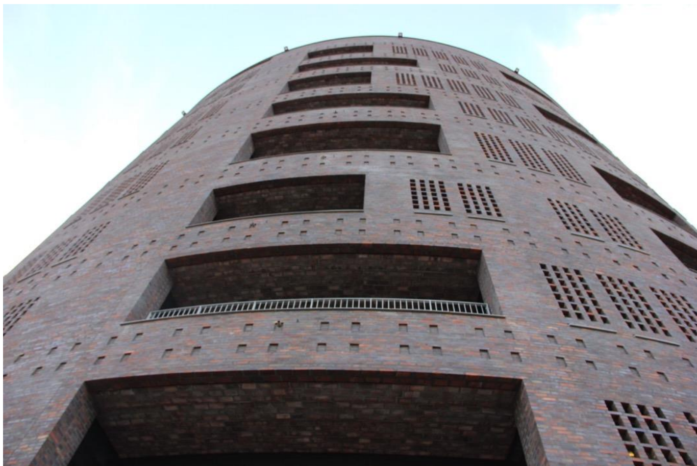
Facaden er inspireret af gamle stationsbygninger.