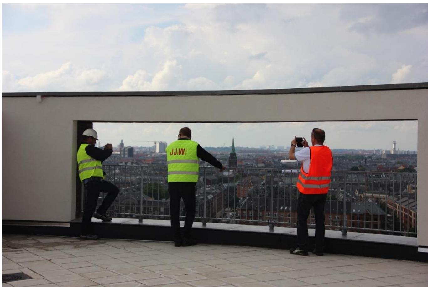
Toppen af Trafik Control Center Øst, hvor vi alle samles efter rundvisningen.