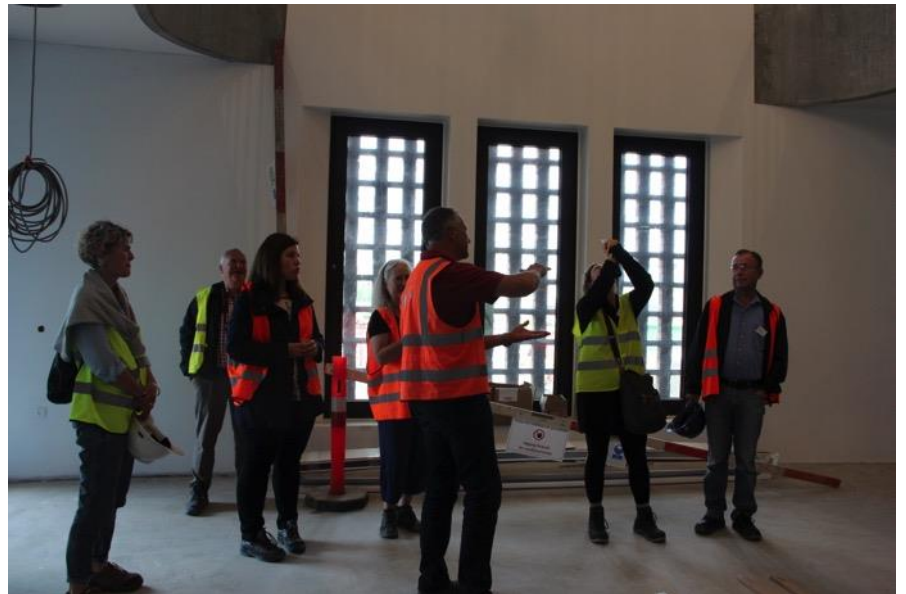
Grundet sikkerhedsmæssige foranstaltninger vises der ikke yderligere billeder af Trafik Control Centeret indefra.