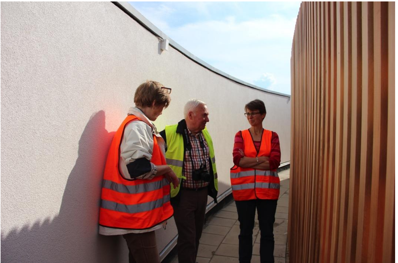
Efter rundvisningen i det fine nye Trafik Control Center afslutter vi eftermiddagen med hyggelig networking.