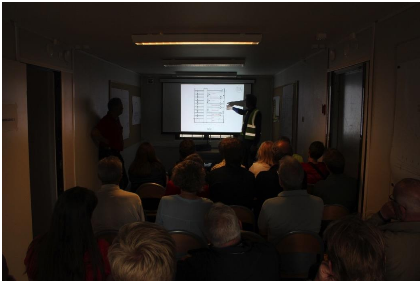
Trafik Control Centeret vil bl.a. rumme fire store søjlefreie kontrolrum, hvorfra jernbanenettet vil blive styret.