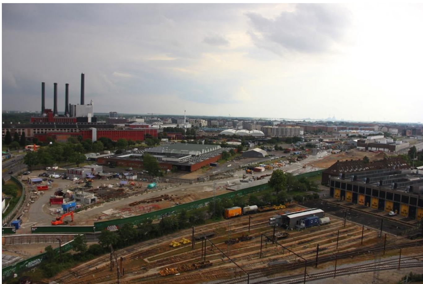
Udsigten fra toppen af Trafik Control Center Øst.