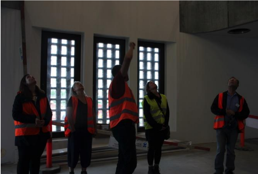
Trafik Control Centeret skal huse både Banedanmark og Vejdirektoratet.